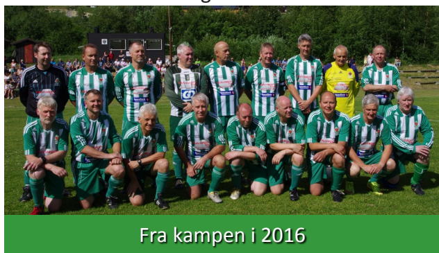
Fra kampen i 2016

Heidal/Faukstad - Kvam IL, - i Heidal. Gledelig gjensyn med tidligere spillere. Returoppgjør fra fjorårets store kamp mellom gamle helter.