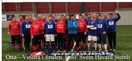
Otta—Vinstra i finalen.

Lørdag 25. mars ble det arrangert GR-Cup for voksne menn i Kvamshallen.