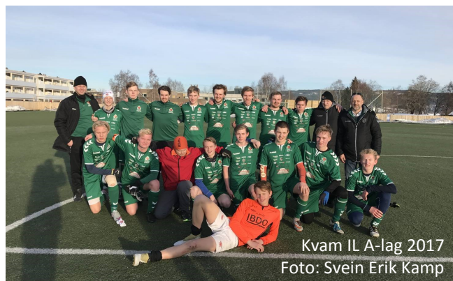
Kvam IL A-lag 2017

Kom og heie på guttene som har lagt ned en god treningsvinter. Husk også scoringskontrakter.