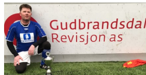
Gudbrandsdal Revisjon as

I alt stilte det fem lag: Kvam, Otta, Lom, Vinstra og Heidal, der alle måtte være 34 år eller eldre. Det ble spilt 7-er fotball, med seriespill der alle lag møttes innbyrdes til 15 minutters omganger. De to som toppet tabellen etter seriespillet møttes til en finale. I finalen seiret Vinstra 4-3 over Otta.